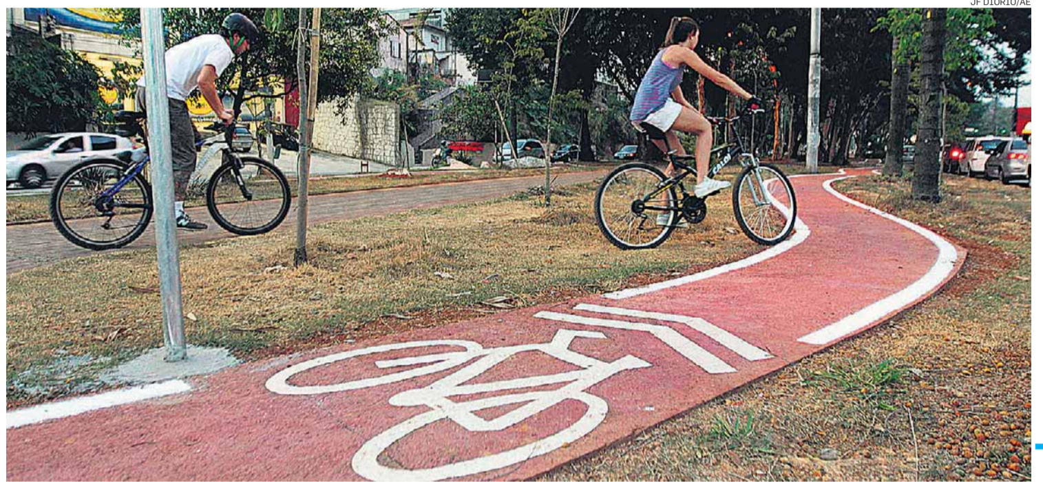
Em harmonia. A ciclovía ficará no canteiro central da avenida e não vai atrapalhar quem caminha ali, garante a Prefeitura

Malha. Segundo a Secretaria de Transportes, a cidade de São Paulo passará dos 200 km de infraestrutura para bicicletas com a ciclovía da Brás Leme, chegando a 203,2 km. Os ciclis-