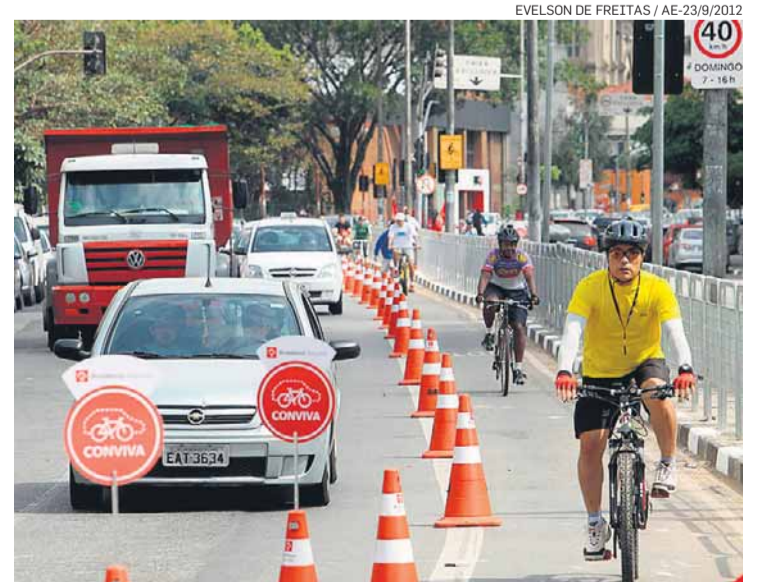
Sem pedal. Nenhuma ciclofaixa será ativada na cidade

Quem for passar pela Avenida Duque de Caxias, no centro, terá de usar apenas a pista da direita, já que a da esquerda será bloqueada entre o Largo do Arouche e a Avenida São João no sábado, das 6h às 14h, e no domingo, das 6h às 20h, por causa da logística de distribuição e recebimento de urnas eletrônicas. /R.B.