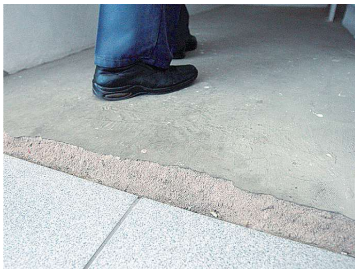
Nos conjuntos, problemas na obra são visíveis em paredes e pisos. Sistema de captação de energia solar também não está em funcionamento

As edificações integram o Programa Socioambiental da Serra do Mar, do Governo paulista, voltado à preservação da Mata Atlântica, no Parque Estadual da Serra do Mar, em Cubatão. (EB)