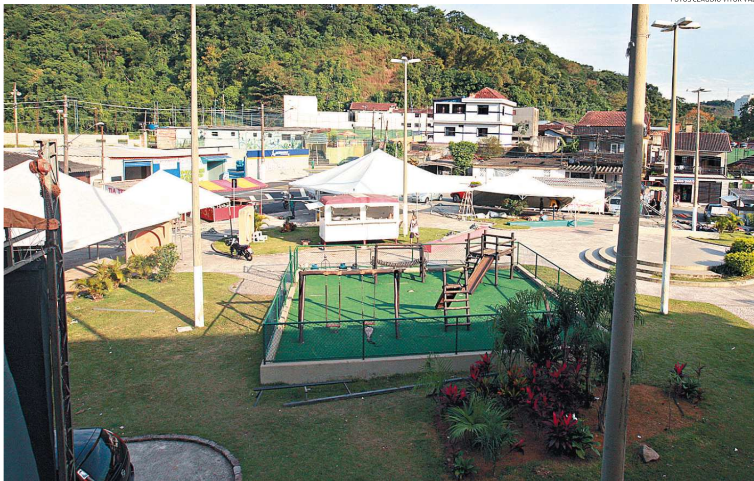
Durante toda a semana, os preparativos foram intensos para que as 60 barracas, o palco, o restaurante e a animação estejam no ponto

Embora a festa seja promovida pela Paróquia São João Batista, as barraquinhas de rua