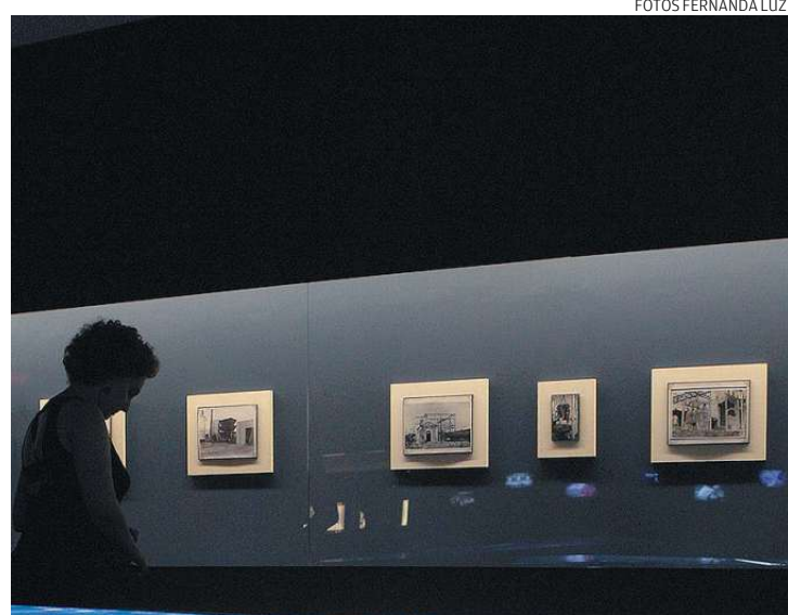
As conquistas do setor elétrico possibilitaram tornar o mundo menor