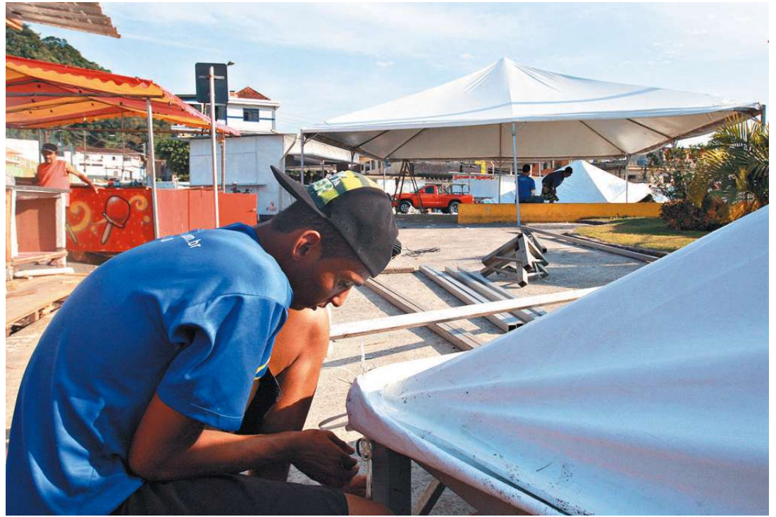
Serão 45 dias de arraial, com comidas típicas, música e brincadeiras. Tradição que já dura 66 anos

A Quermesse do Morro da Nova Cintra acontece diariamente, na Praça Guadalajara, sendo que de domingo a quinta-feira, é das 20 às 24 horas; às sextas e sábados, das 20 horas à uma da manhã.