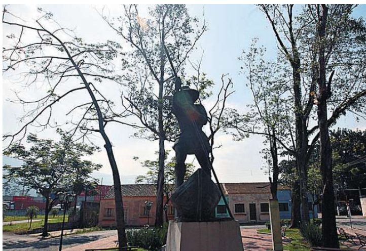
... Pça. Cel. Joaquim Montenegro: caminho por onde passou D. Pedro I

para a conclusão, pelo Iphan, do processo de tombamento do lugar de onde D. Pedro I partiu antes de proclamar a Independência do Brasil.