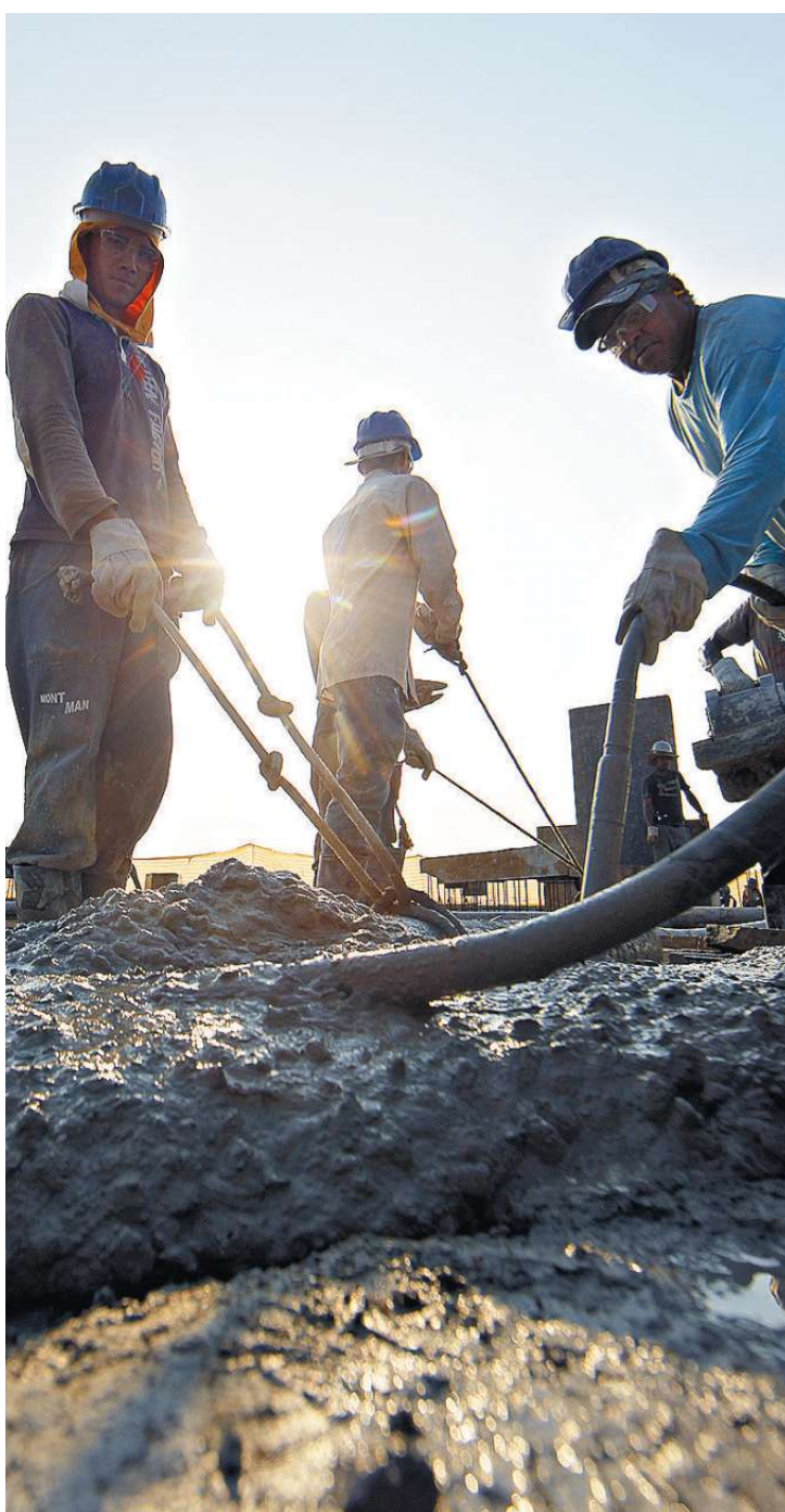
Os novos empreendimentos também valorizaram a categoria na BS