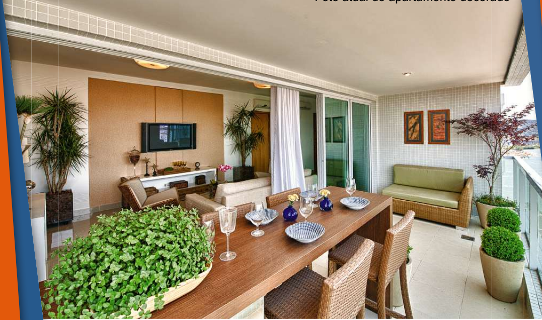
Foto atual do apartamento decorado

Venha se surpreender duas vezes: com a beleza dos decorados e com as facilidades de pagamento.