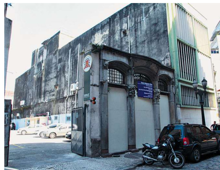
O número 88 da Rua XV, onde ele nasceu, pode virar um memorial

Outra personalidade histórica – entre tantas – de Santos, o médico e poeta Martins Fontes (1884-1937) também morou em mais de uma casa na Cidade. Ele teria nascido na casa número 4, na Praça José Bonifácio, e vivido na Rua 7 de Setembro e na Avenida Presidente Wilson, 68, no José Menino, hoje o Edifício Piratininga, que estampa, na fachada, um poema de Fontes, que diz: Beijemos nós a Terra em que nascemos/ Sobre a qual se ergue o teto onde vivemos.