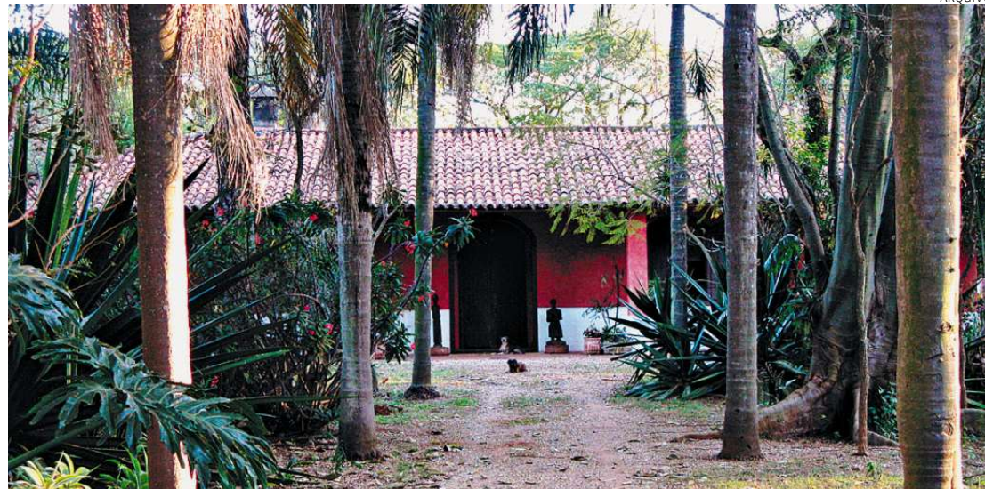
Entrada da Casa do Sol, onde funciona o Instituto Hilda Hilst que realiza intercâmbio com artistas

Com 800 metros quadrados de construção, localizada a 130km de São Paulo, entre Campinas e Jaguariúna, a casa abriga, desde 2005, a sede do Instituto Hilda Hilst ( www.hilst.com.br ), que tem como missão preservar a casa tal qual Hilda a deixou.