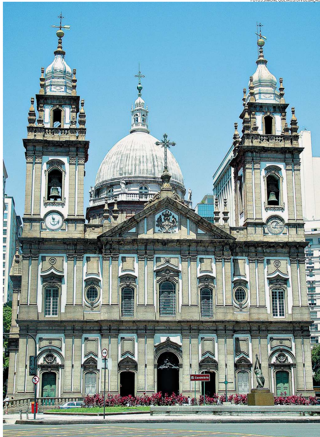
Segundo a lenda, a Igreja Nossa Senhora da Candelária originou-se de uma pequena ermida erigida em 1609

E que extensão! São 106 metros de diâmetro, 75 metros de