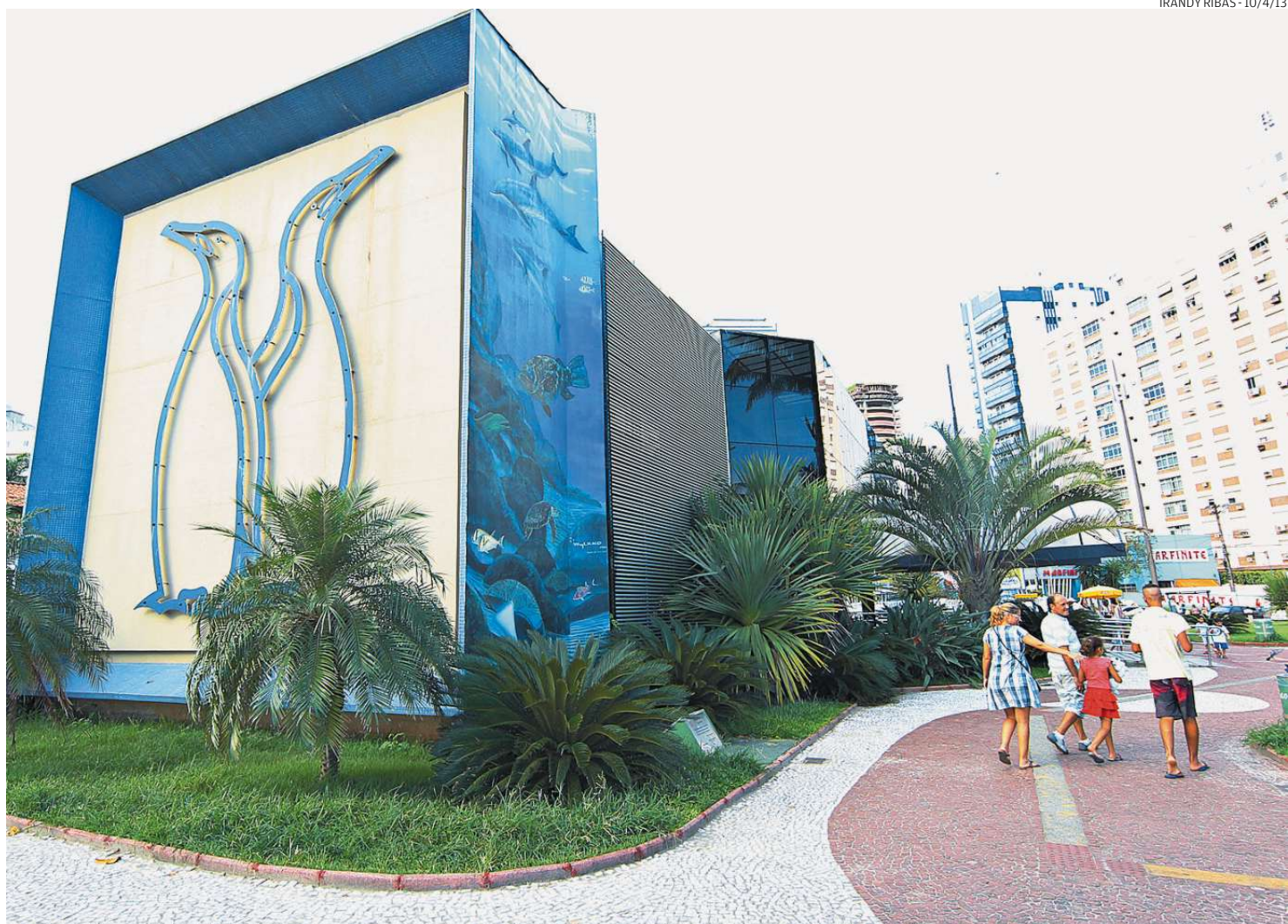
Um dos equipamentos turísticos que mais passaram por obras nos últimos tempos em Santos, o Aquário contou com verbas vindas do Dade

O secretário Estadual de Turismo, Cláudio Valverde, acha a mudança necessária porque