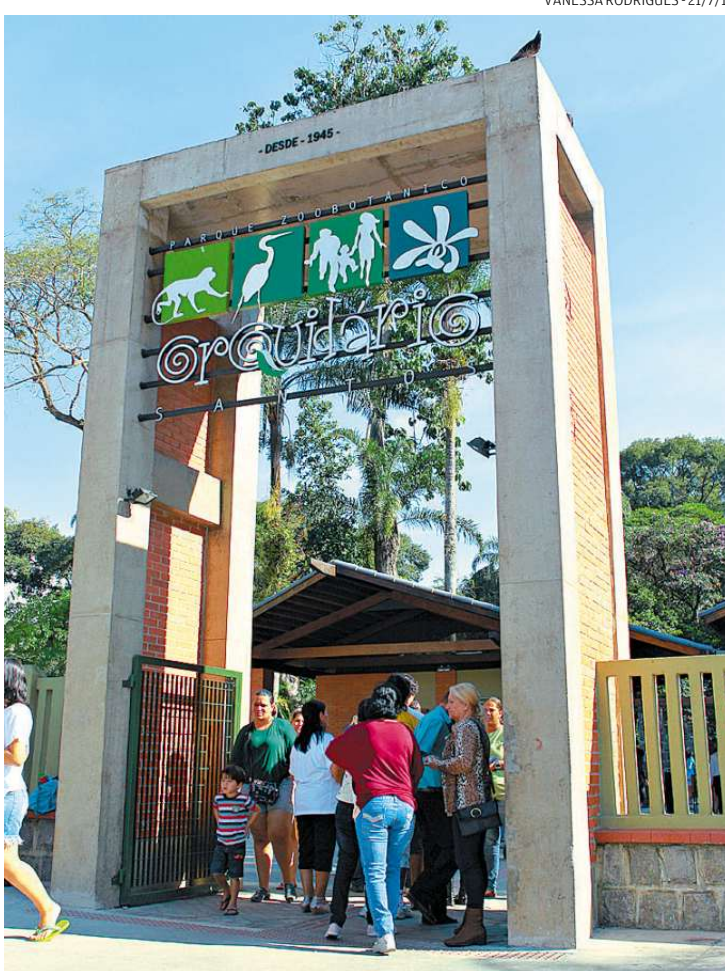
Recursos do órgão estadual viabilizaram a reabertura do Orquidário

muitas estâncias, por falta de documentação, não liberam o dinheiro do Dade. "Como esse dinheiro faz parte de um fun-