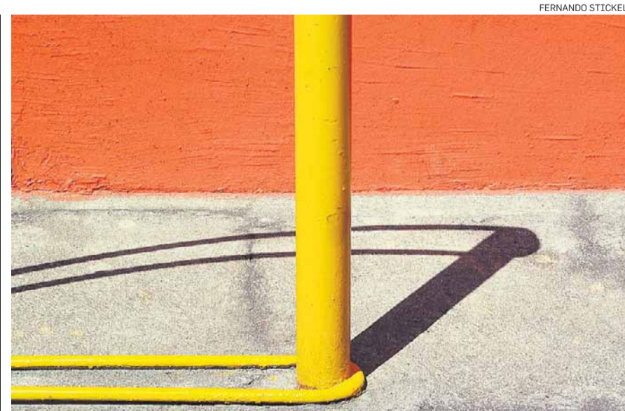
De um bairro a outro. Cenas urbanas como a imagem acima, clicadas por Fernando Stickel na Vila Olímpica, estão em exposição até o dia 6 na Casa de Cultura da Brasilândia (Praça Benedita Cavaleiro, sem número)

Arrecadação anual de R$ 2,9 bilhões por ano e a criação de 500 mil empregos diretos e indiretos.