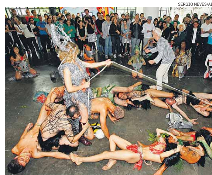
Performance. Atores reencenam peça dos anos 30