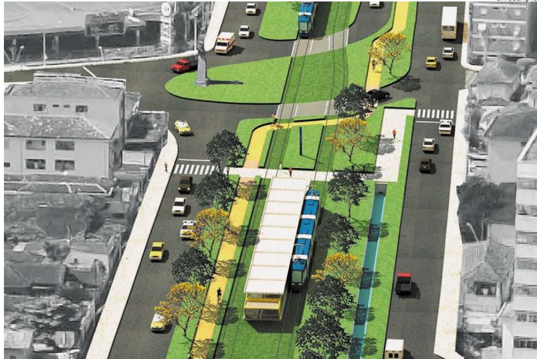
Sistema deve atender cerca de 70 mil passageiros por dia. Primeira fase liga Terminal Barreiro ao Porto