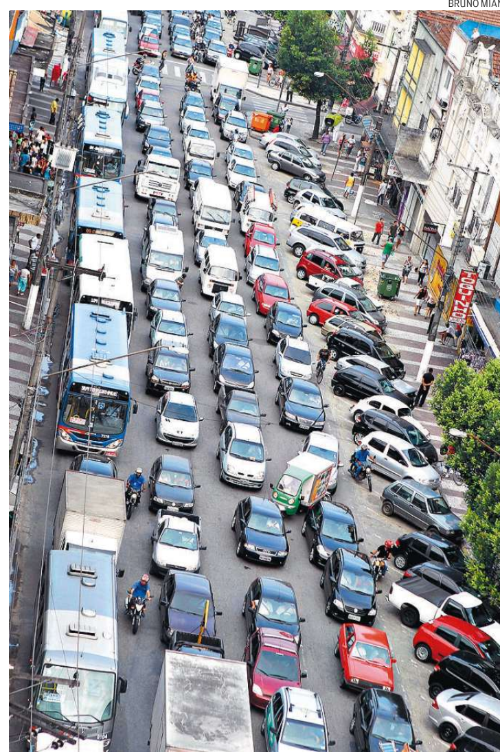
Entre as principais novidades, o estacionamento, que deixa de ser em 45 graus e passa a ficar ao longo da via, além da criação da ciclovia