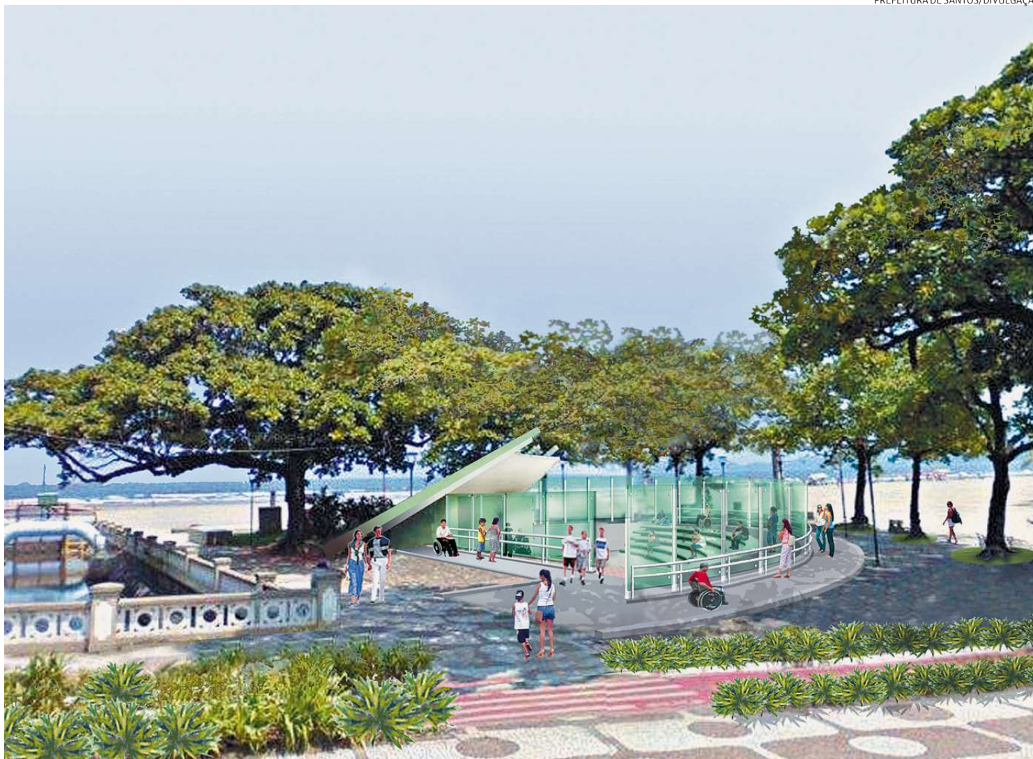
O novo palco da orla terá 370 lugares, sendo 120 em pé e 250 sentados. À volta, painéis de vidro de 16 milímetros restringirão o som ao local

“Já fomos informados sobre esse teste. Estaremos acompanhando-o assim que for oficializada a data”, disse o promotor de Meio Ambien-