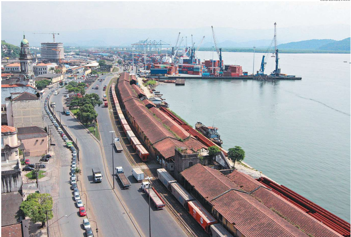
Área dos armazéns 1 ao 8 passará por uma grande revitalização dentro do projeto. Parceria público-privada pode ajudar a tirar do papel

O informativo sobre o pleito para presidente da República e para a Assembleia Nacional Constituinte foi exibido em todas as salas de cinema, naquele ano. A população não participava de eleições desde 1936. Em tempo: Gaspar Dutra (PSD) acabou saindo vencedor.