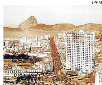
Marco histórico. Edifício abrigou a Rádio Nacional

O espaço físico do prédio foi remodelado. O 21.º andar rece-