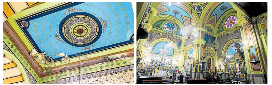
Vandalismo e abandono. MP ajuizou ação civil pública para apurar irregularidades na gestão