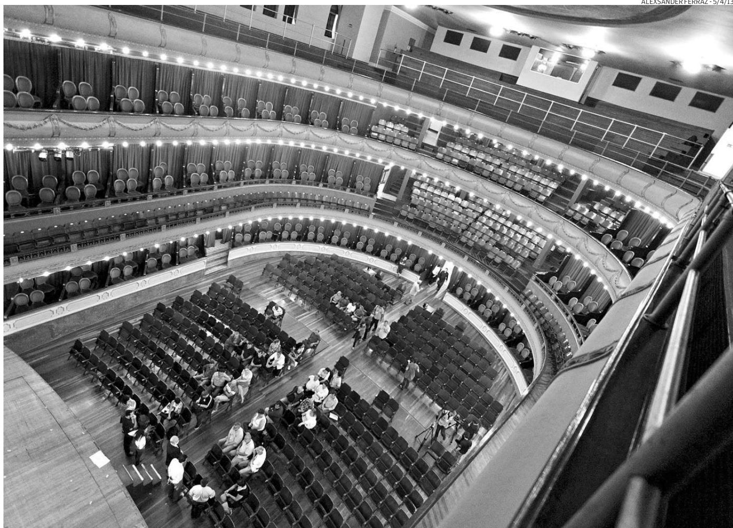
Até o final de abril de 2014, o equipamento vai permanecer fechado para a realização de reforma na infraestrutura e rede de ar-condicionado

A diretora teatral esperou dos anos 1970 até 2006 para voltar a pisar no local. "Todas as vezes que ia ao Coliseu, tinha a sensação de voltar ao passado