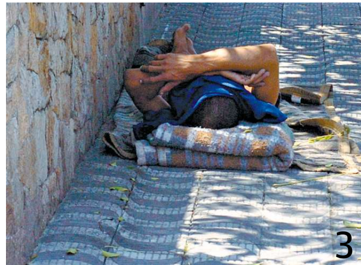
-1- caminhões por todos os lados. -2- consumo de drogas às margens da via férrea. -3- expressivo número de moradores de rua