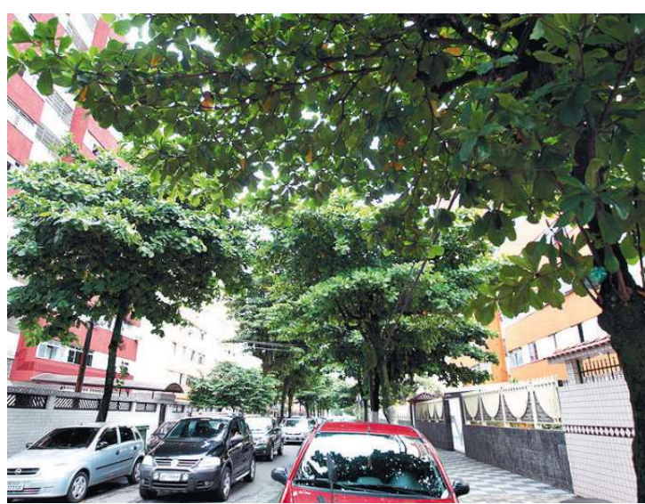
Na Rua Guedes Coelho, sensação de insegurança só vem aumentando