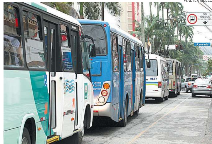
Faixa exclusiva na Ana Costa foi a primeira implantada, em 2009

Em 2009, a Avenida Ana Costa recebeu o primeiro corredor de ônibus. Por conta do número de faixas de rolagem, ele é exclusivo para a circulação de coletivos, de segunda a sexta-feira, das 6 às 9 horas, no senti-