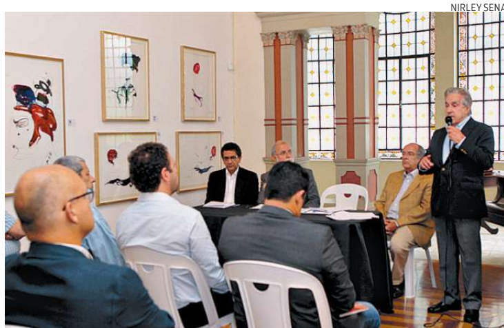
Em encontro ontem, no Casarão Branco, foram divulgados os planos

Segundo Paulino, o aumento da frequência ainda pode ser