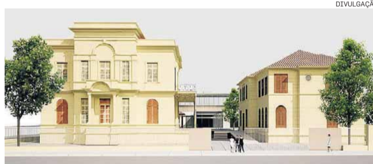
Projeto. Extensão também terá auditório e cafeteria