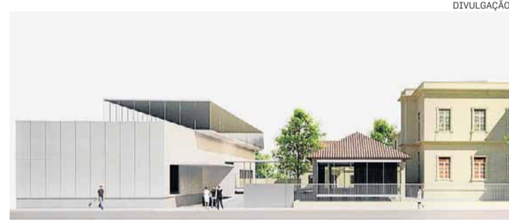
Cronograma. Construção começa no segundo semestre

abertura completa do arquivo vai atrair mais público ao museu”, aposta a superintendente da Fundação Energia e Saneamento.