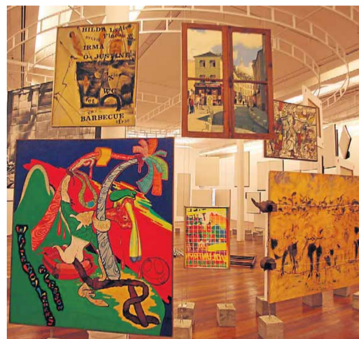
Em círculos. Obras da coleção do marchand Jean Boghici

16h00 e 20h00 | Domingo: 11h30, 15h30 e 19h00