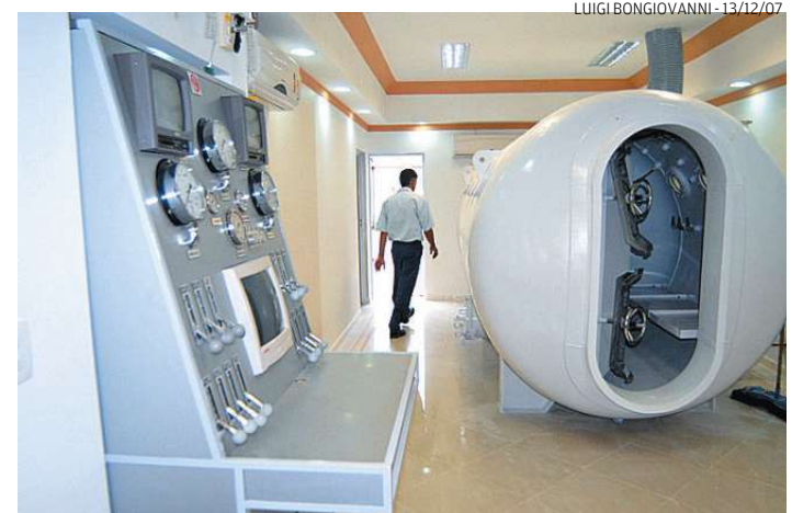
O atendimento na câmara hiperbárica não é coberto pelo SUS

Hoje, a Cidade possui contrato com a Santa Casa. De quatro a cinco pessoas são encaminhadas mensalmente pela Secretaria Municipal de Saúde para fazer o tratamento.