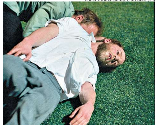
A dança faz parte do cotidiano da entidade, que ao longo do ano realiza várias ações na modalidade

Mas a Bienal é o ápice de todo um trabalho que é desenvolvido ao longo do ano. Outras iniciativas de ação permanente, para atrair mais adeptos à dança, integram o calendário da instituição. “O Sesc procura abraçar as mais dife-