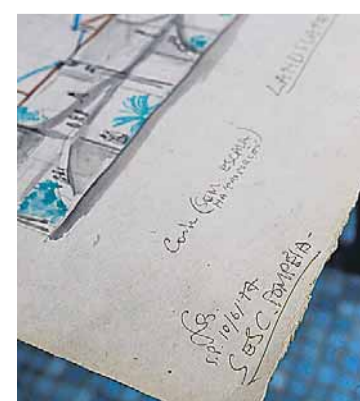
Acervo. Detalhe de esboço

Por ora, a Casa de Vidro, sede da entidade, é aberta à visitação do público mediante agendamento. A exposição The Insides Are on the Outside / O Interior Está no Exterior , que vem sendo preparada desde 2011 e tem cura-