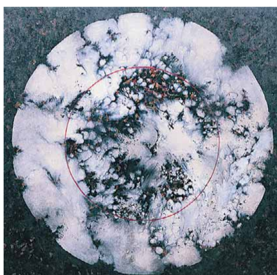
Fases de abstração. No alto, tela criada em 1978 e, ao lado, pintura de 1994: percurso