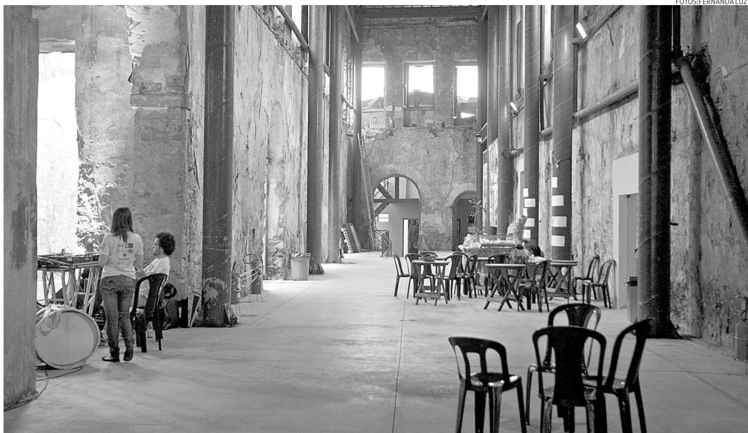
Construído em 1865 para funcionar como armazém, o grande sobrado passou por restauro na década de 90 e hoje abriga exposições culturais

Ele removeu os azulejos que ainda restavam para higienizar e dessalinizar um a um. "Não adiantava só fazer as répli-