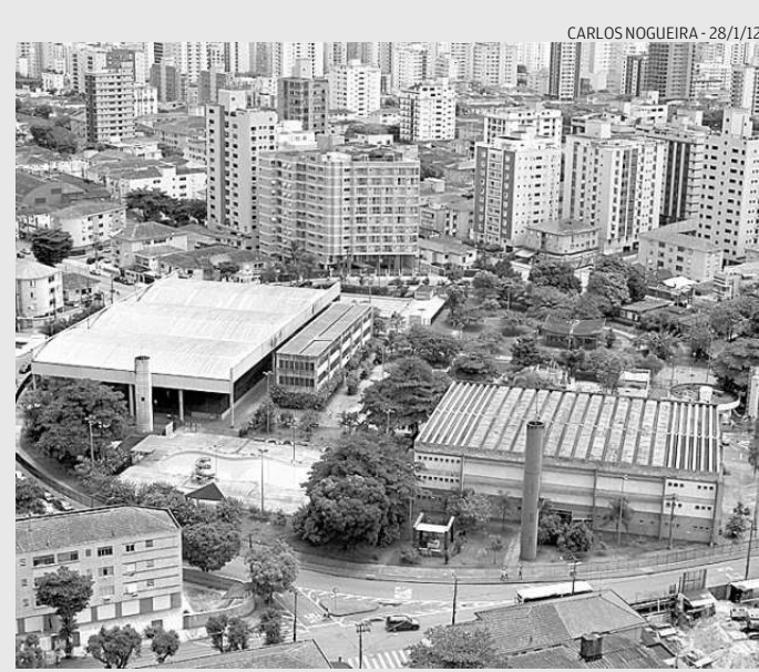
CARLOS NOGUEIRA - 28/1/12

Alunos que frequentaram o Centro Recreativo Esportivo Rebouças em 2012 precisam se cadastrar até 8 de fevereiro para participar das atividades neste ano. Deve-se ir ao local de 2ª a 6ª-feira, das 8h30 às 11h30 e das 14h30 às 17h30. Detalhes pelo telefone 3261-1980. Quem faltar perderá a vaga.