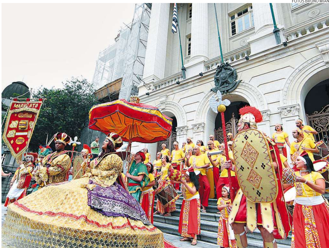
Diante do Palácio José Bonifácio, sede da Prefeitura, uma demonstração de cores, ritmo e empolgação