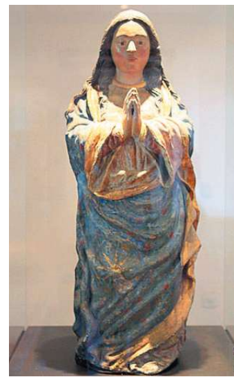
Feita em 1560, por João Gonçalo, a imagem de N. S. da Conceição é considerada a mais antiga do País

to. Funciona de terça a domingo, das 11 às 17 horas. Os ingressos custam R$ 5,00. Estudantes e aposentados pagam meia entrada. Há visitas monitoradas e o acesso a capela é livre.