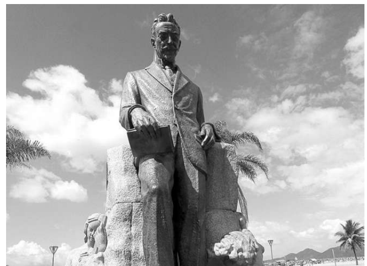
O poeta do mar, Vicente de Carvalho, está imortalizado na praia

“Costumo vir todo ano para visitar a minha filha, que mora aqui. Toda vez que venho à praia tiro foto das minhas netas no leão, mas nenhuma de-