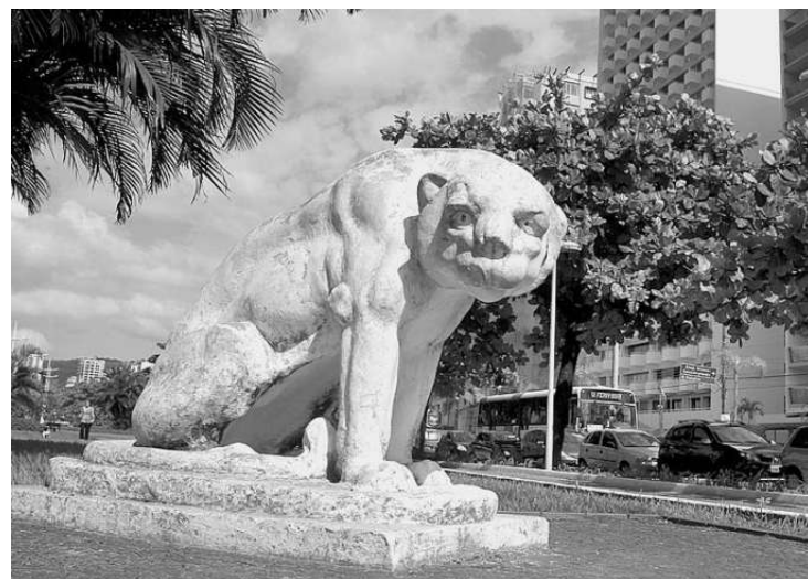
O outro leão, que na verdade é um jaguar, é mais uma atração

a história desconhecida. Já o leão foi inaugurado em 1954 em homenagem às benfeitorias da Prefeitura na região da orla.