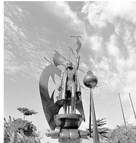
Desde 1992, o monumento a Cristovão Colombo é destaque no Posto 2