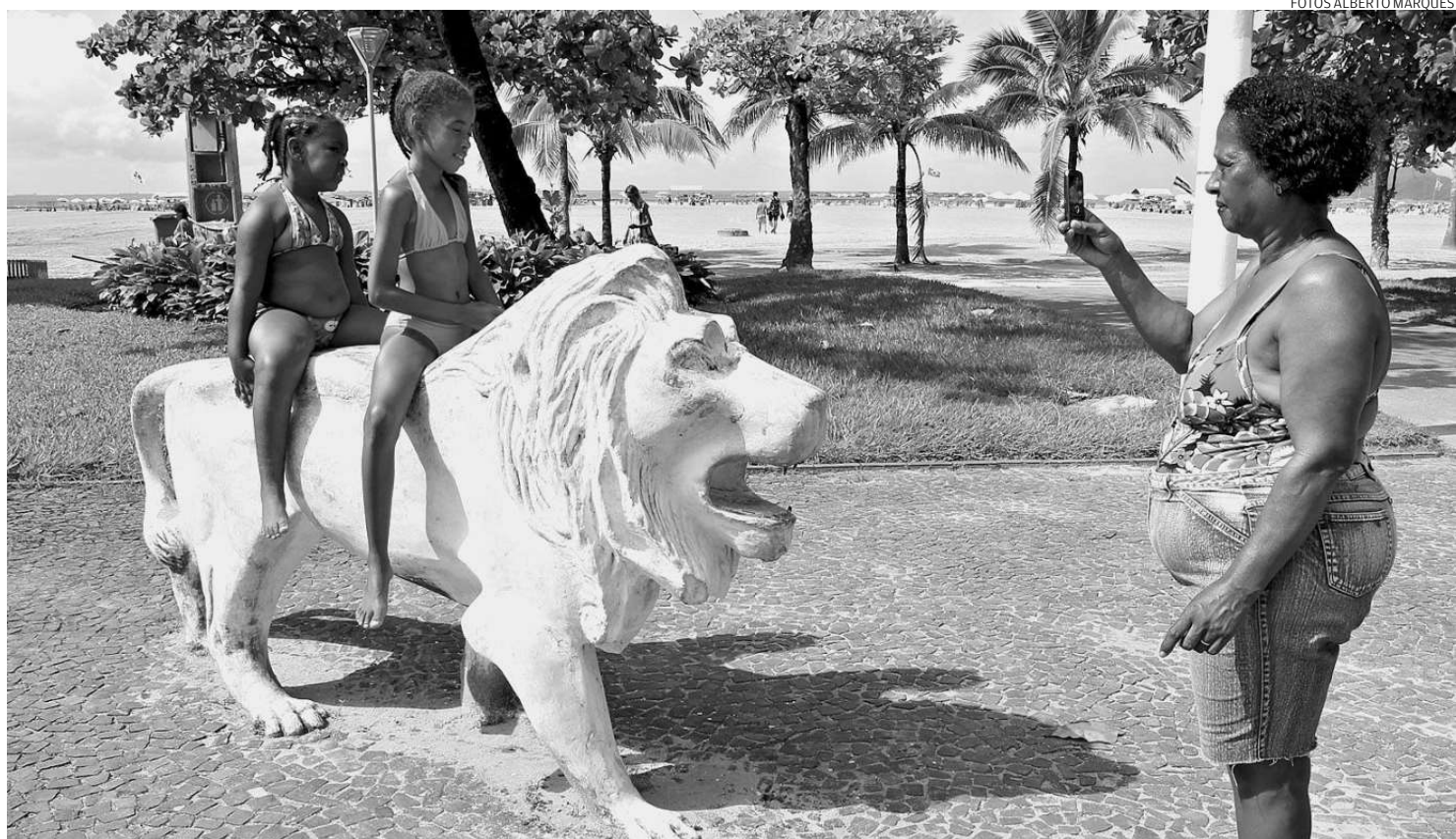
Instalado desde a década de 50 na praia do Gonzaga, o monumento do leão é parada obrigatória para fotografias de moradores e turistas

Na verdade, os monumentos não são de dois leões, mas sim, de um leão e de um jaguar. O segundo, inclusive está no local há mais tempo, desde 1951 e tem