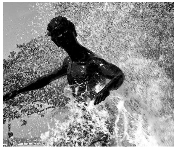
O monumento ao surfista faz homenagem à prática do esporte na cidade