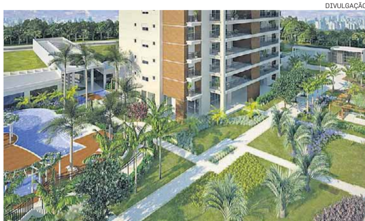
Alto padrão. Apartamentos custam até R$ 5 milhões

O embargo é mais um capítulo da batalha travada por moradores do bairro contra a construção do condomínio. Por meio de uma petição pública, o grupo denunciou à gestão Gilberto Kassab (PSD) que o Rio Boa Vista, canalizado nos anos 1960, corta o terreno e, por isso, inviabiliza a construção – segundo a legislação ambiental brasileira, são proibidas novas edificações à beira