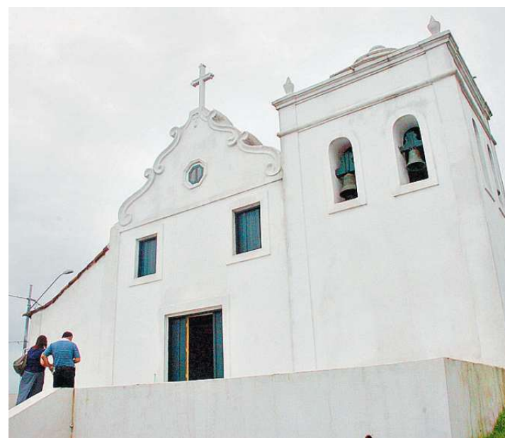
No local ainda há a secular Igreja Nossa Senhora do Monte Serrat