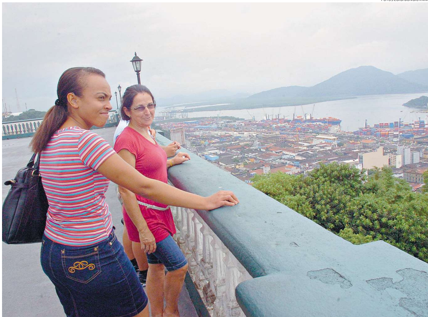
Do mirante, os visitantes podem avistar o cais santista, vários bairros, o Centro Histórico, além de pontos da Área Continental do Município