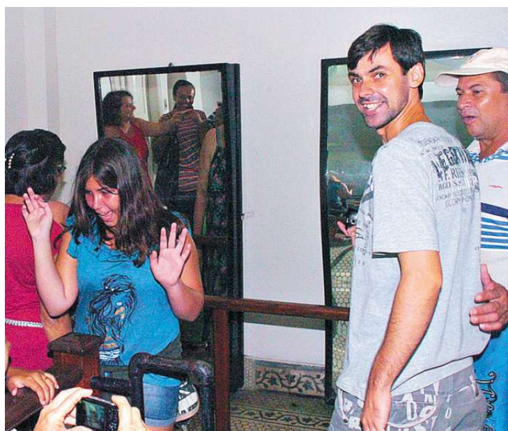
A diversão é garantida na sala de espelhos que alteram a silhueta