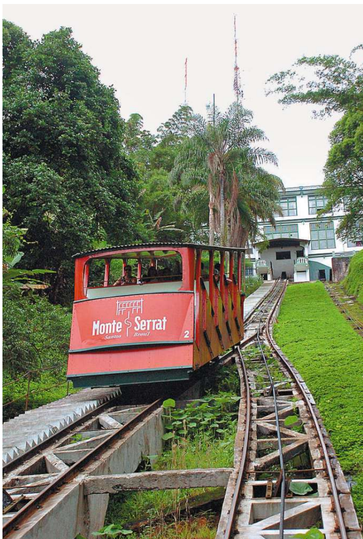
Em 1927, o bonde começou a levar as pessoas até o alto do Morro