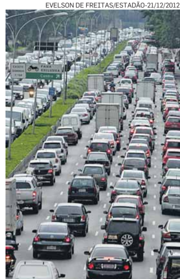
Horário de pico. Avenida 23 de Maio, às 17h01

Em vigor desde 1997, o rodízio retira diariamente 20% dos veículos de circulação nos horários de pico. Vale apenas no centro expandido, das 7h às 10h e das 17h às 20h. A multa para quem desrespeita a restrição é de R$ 85,13, além de quatro pontos na Carteira Nacional de Habilitação (CNH). Ao todo, a cidade tem cerca de 600 radares capazes de identificar placas de veículos que desrespeitam o rodízio.