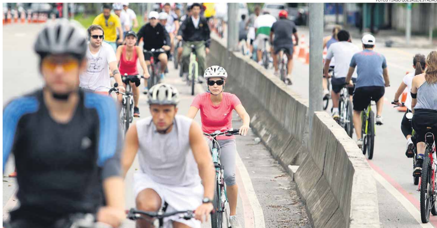
Movimento. Ciclofaixa da Avenida Presidente Juscelino Kubitschek não fica vazia nem em dias nublados, como ontem

Ele conta que nas proximidades das duas áreas verdes a quantidade de bicicletas é bem maior do que em outros trechos da ciclofaixa. “A confluência de bicicletas por aqui é muito grande. Os parques concentram as pes-