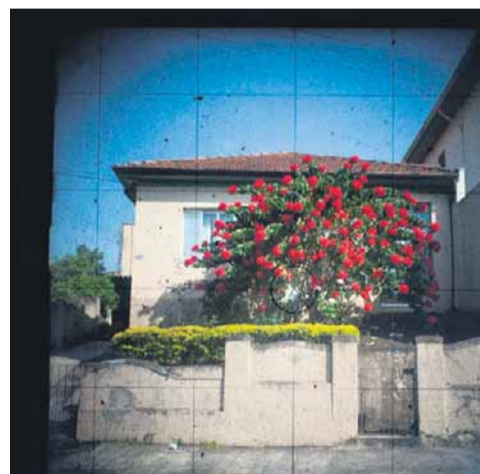
Rua Croata. O fotógrafo pretende também fazer um filme com as imagens