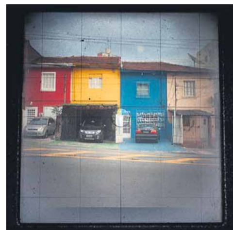
Avenida Pompeia. Bairros de Perdizes e Pompeia foram os mais fotografados