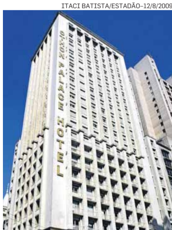
Prédio. Luxo dos anos 1960

2. Por que ele fechou? Com o processo de degradação do centro histórico durante os anos de 1970 a 1990, os hóspedes de hotéis de luxo passaram a preferir endereços que foram sendo abertos em regiões co-