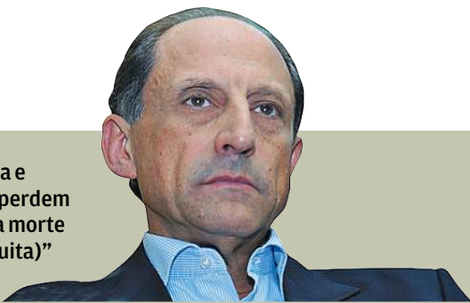
Paulo Skaf PRESIDENTE DA FIESP-CIESP