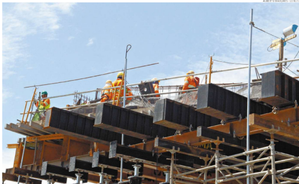
Até o final do ano, outros 300 mil podem ficar sem trabalho. É o resultado da retração no setor, causada pela crise política e econômica

Para Bauer, é preciso evitar o pessimismo exagerado e "ter motivação para manter a equipe, a coesão das pessoas e foco.