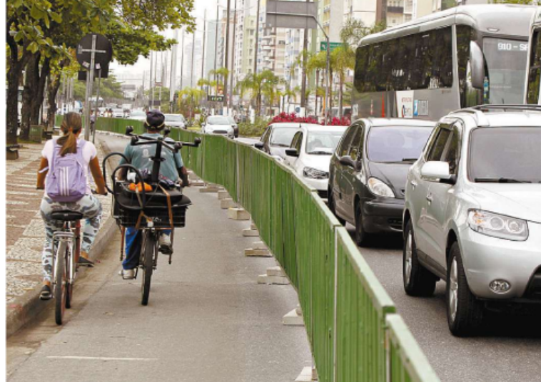
Obras. Também em Santos, a Prefeitura continua a reurbanizar a ciclovia da orla. A obra transcorre no José Menino, com espaço provisório para ciclistas. O serviço completo custará R$ 5,02 milhões e vai durar cerca de mais oito meses.