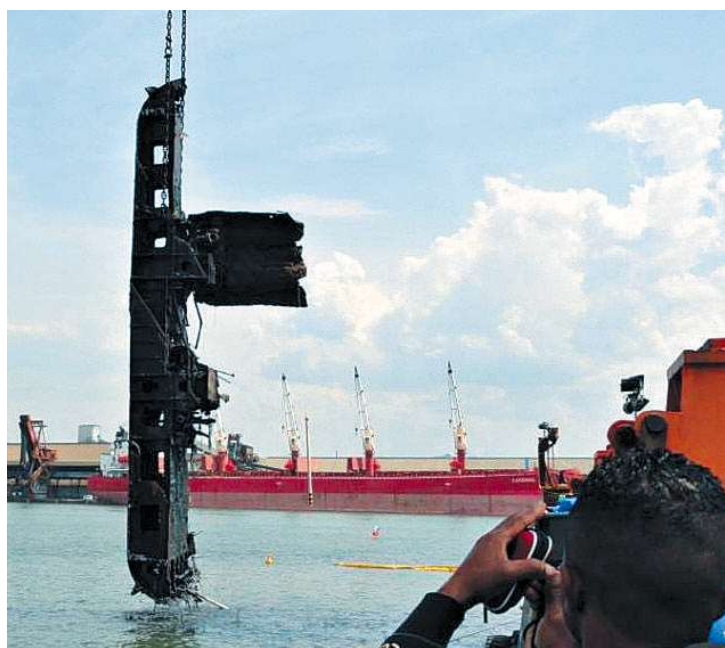
Retirada dos restos do Ais Giorgis: mais 3 peças serão içadas em janeiro

No próximo ano, o Porto de Santos também ampliará sua infraestrutura de movimentação de cargas com a entrega das primeiras fases dos terminais da BTP (1º trimestre) e da Embraport (maio) e de pelo menos um berço no novo Cais de Outeirinhos (outubro), que está sendo alinhado, conforme reportagem publicada na edição de A Tribuna do último domingo.