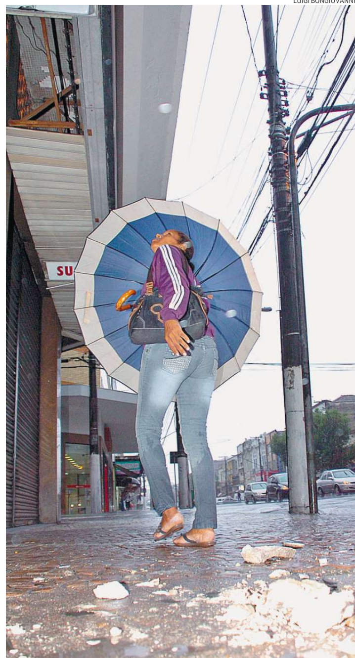
Quem passou neste ponto da rua João Pessoa, sábado, se assustou