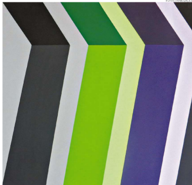
Artista traz ao Casarão 15 telas e uma escultura que retratam parte de sua trajetória, a partir da década de 1990: obras seguem a estética geométrica, sua marca registrada

ve sobre artes visuais em jornais, revistas e catálogos de exposições, além de participar com frequência de comissões de arte da Secretaria de Cultura do Estado de São Paulo e do Museu Brasileiro da Escultura (Mube).