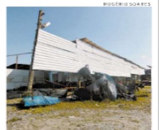
Lado problemático era do lado da escola de samba Amazonense