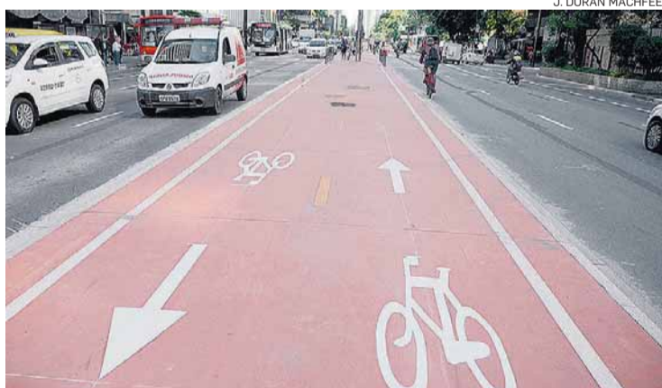
Eixo central. Nº de ciclistas deve triplicar com inauguração

169 bicicletas passavam no horário de pico da tarde na via antes de as obras de construção da ciclovia começarem, segundo a CET