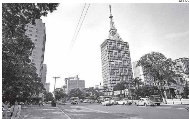
Registro. Avenida Paulista em 1969, antes da reforma

As obras na avenida começaram em 1972. Uma das primeiras mudanças foi o corte de cerca de 120 ipês que ainda mantinham o ar bucólico, junto com seus casarões, que dividiam espaço com os prédios. A avenida também perdeu o espelho d'água que ficava na frente do Parque Trianon.