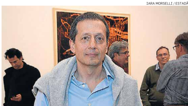
Muszkat. Para executivo, 'a demanda por imóvel ainda existe'

Segundo ele, a You, Inc tem hoje 50 unidades prontas em estoque, de um total de quatro mil lançadas desde 2010. "Isso é menos do que eu tinha em 2014. Entendo que, se o preço do imóvel é condizente e o produto é