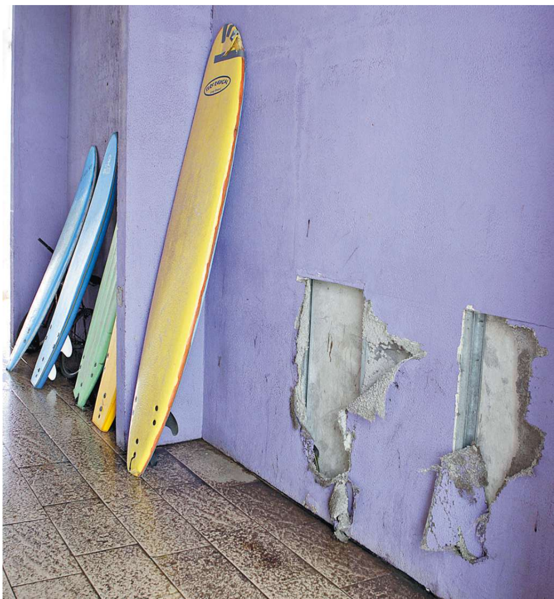
Em algumas paredes, parte do revestimento já caiu e deixou à mostra a estrutura interna da construção

Por causa da situação do edifício, o acervo, composto apenas por doações, foi encolhendo. “As pessoas viam e não queriam mais expor”. Com isso, cerca de 70 pranchas históricas, e mais de 100 quadros ilustrativos, já foram retirados. “As pranchas estragando, os quadros desbotando (pegando sol), a Prefeitura não colocava cortina, nem deixava colocar. Se não tem condição de cuidar, não é justo que se estrague”.