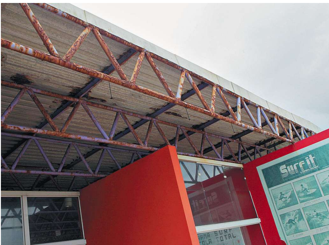
Vigas que sustentam o teto da atração têm ferrugens aparentes e que preocupam os frequentadores