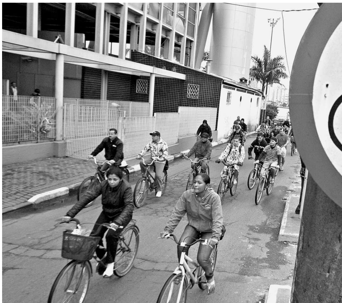
Prefeitura tem planos de ampliar a malha cicloviária para 35,80 quilômetros até o começo de 2016

A taxa de crescimento para automóveis de passeio, em idêntico período, foi de 85,31%, mas a evolução do universo de motocicletas atingiu a elevada marca de 237,46% e até mesmo a frota local de cami-