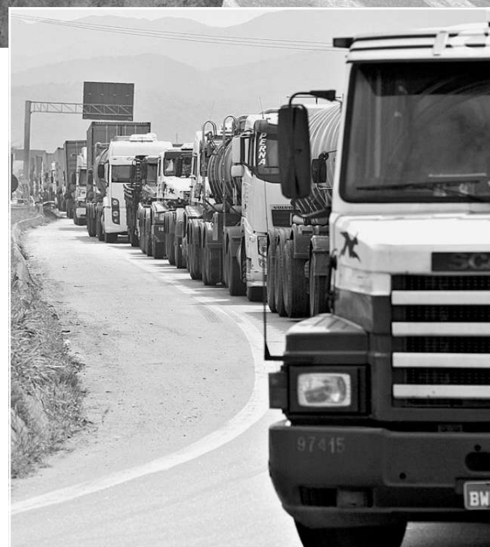
Conclusão da Avenida Perimetral deve amenizar tráfego portuário

Com a exigência legal de que todos os municípios com mais