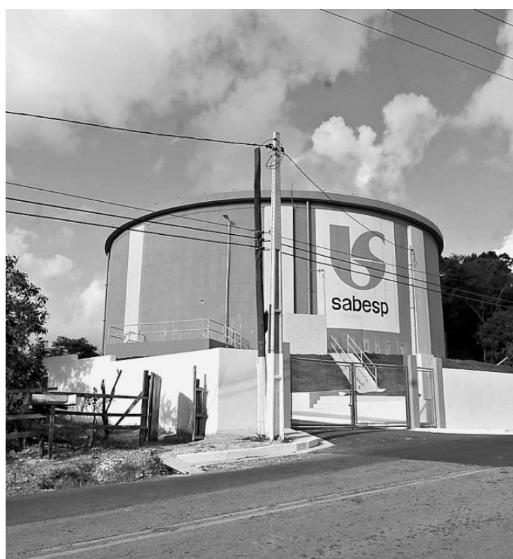
Município e Sabesp terão de renovar contrato para serviços na Cidade

Os congestionamentos no sistema viário geram problemas de saúde e também encarecem o custo da economia, obviamente desestimulando muitos negócios, sobretudo em locais que sobrevivem das atividades de serviços de transporte de cargas ou de lazer e turismo.