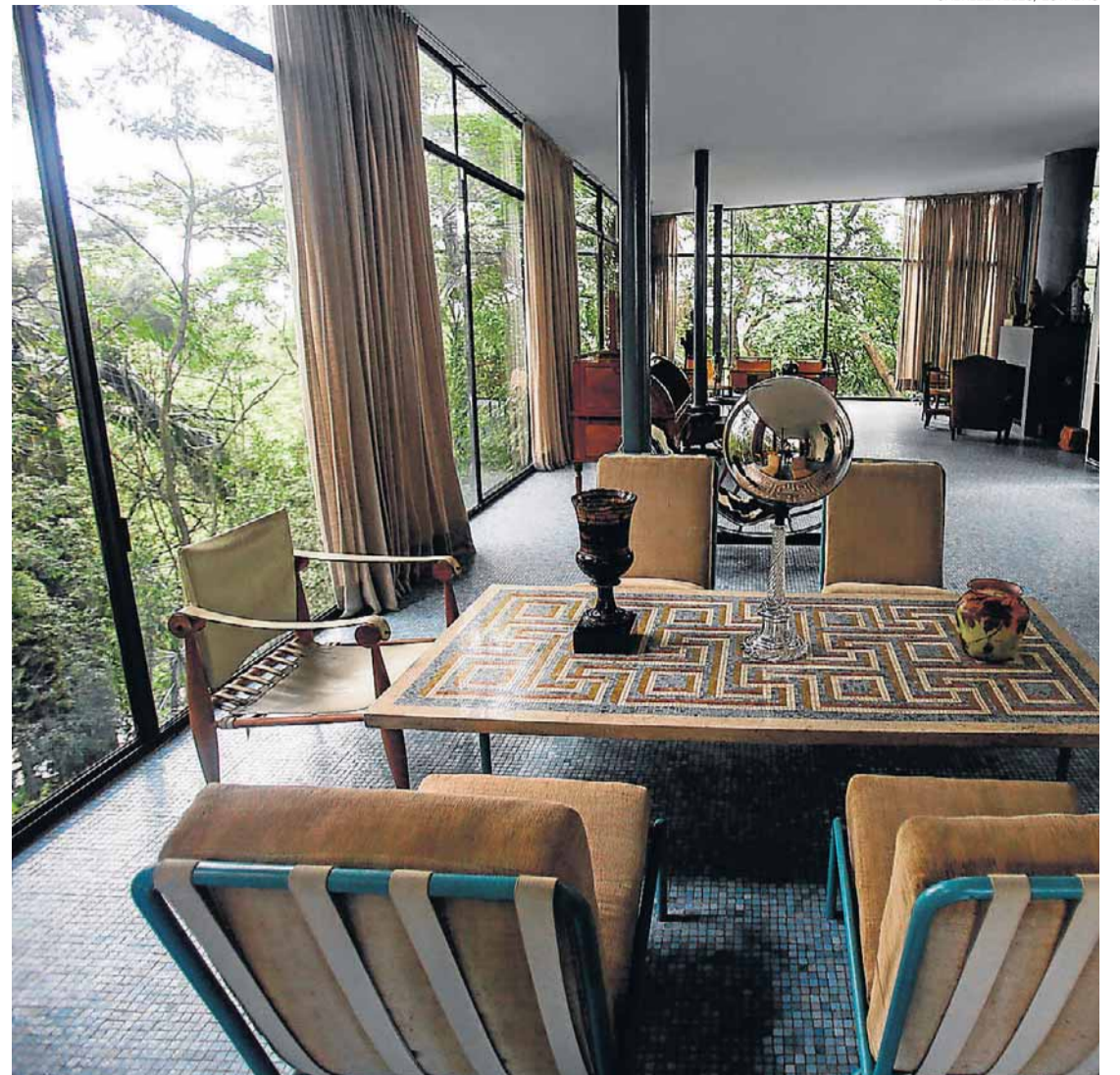
Casa de Vidro. Imóvel projetado por Lina Bo Bardi foi sua residência e hoje guarda acervo

Perto do Pátio do Colégio, marco fundador da capital, fica o Solar da Marquesa de Santos, onde viveu Domitila de Castro Canto e Melo (1797-1867), a mais famosa amante do imperador d. Pedro I. Ela morou ali de