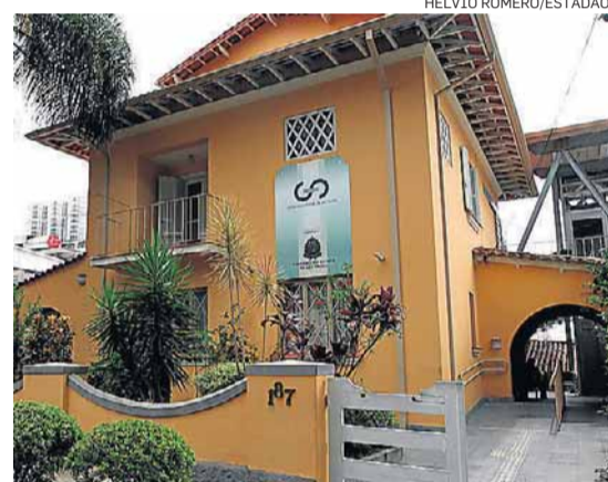
Poesia. Casa de Almeida recebeu artistas