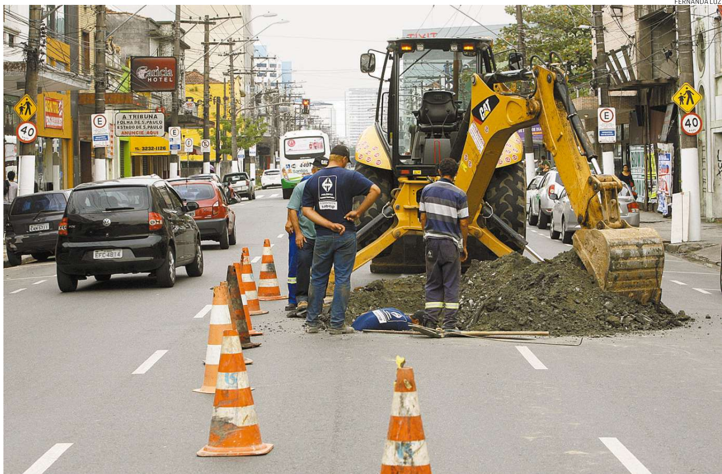
Sabesp realizou no sábado manutenção emergencial na Avenida Senador Feijó, recapeada em dezembro e que já receberá um remendo

A Sabesp, segundo a Prefeitura, concentra os reparos na região dos canais 5 ao 7, onde realizou intervenções nas redes de esgoto e de abastecimento nos últimos meses. Apesar