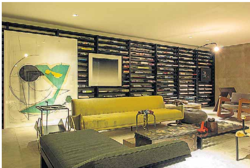
Iluminação cenográfica no ambiente assinado pelo mineiro Pedro Lázaro