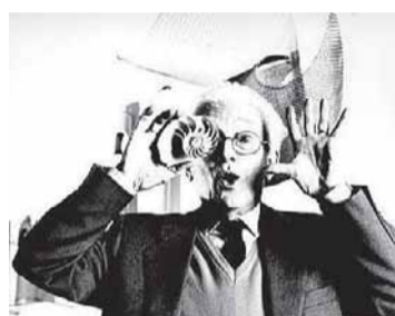
● Inventor e educador Bruno Munari (1907-1998) também criou "laboratórios lúdicos" com atividades sensoriais para crianças.

No catálogo da Bienal, está descrito que Bruno Munari foi "celebrado" pelo crítico e historiador Giulio Carlo Argan como "um dos maiores expoentes da cultura artística italiana". A primeira aproximação que a mostra faz do artista com o Brasil acontece já na abertura da mostra, quando se apresenta na sala inicial Côncavo Convexo (1947-48), obra destacada da trajetória do italiano, colo-