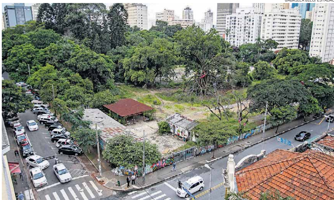
Novidade. Lote pode ter construções que não são da Vila Uchôa e do Colégio Des Oiseaux

Segundo Melo, essas águas de rio ou córrego canalizado “drenam em direção à Rua Frei Caneca e deságuam no Rio Saracura”. Por isso, o interesse sobre “esse trecho de alinhamento de lote com a via pública na Rua Augusta, considerando pesquisa e análise técnica a serem realizadas nos arquivos do anti-