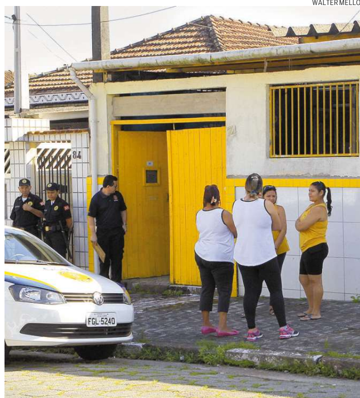
A Guarda Civil Metropolitana fez a segurança da unidade ontem

Para tanto, ela e mais oito funcionárias da escola passa-