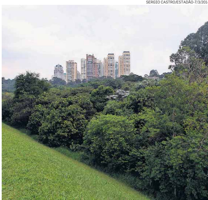
Área de várzea. Seriam cortadas 1.034 árvores nativas

Na carta de desistência, a Cyrela admite que a pressão de moradores do Panamby obrigou a construtora a tomar a decisão. “O acirramento de posições tem evidenciado que não há possibilidade de serem solucionados os atos de resistência em via amigável. Pelo contrário. Eis que recentes e notórias notícias relacionadas com projetos de outros empreendedores na mesma região denotam que há possibilidade real de o caso ser objeto de demandas judiciais