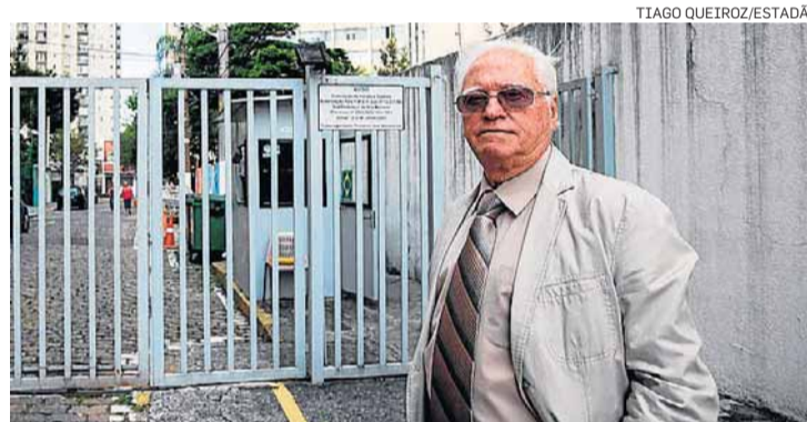
Mathey. 'Até valet vinha estacionar carros aqui', reclama

É o caso das Ruas Leiria e São Giusto, ambas travessas da Avenida IV Centenário, que fica em uma das áreas mais valorizadas da capital, ao lado do Parque do Ibirapuera, na zona sul. Fechadas por cancelas e portões, e vi-