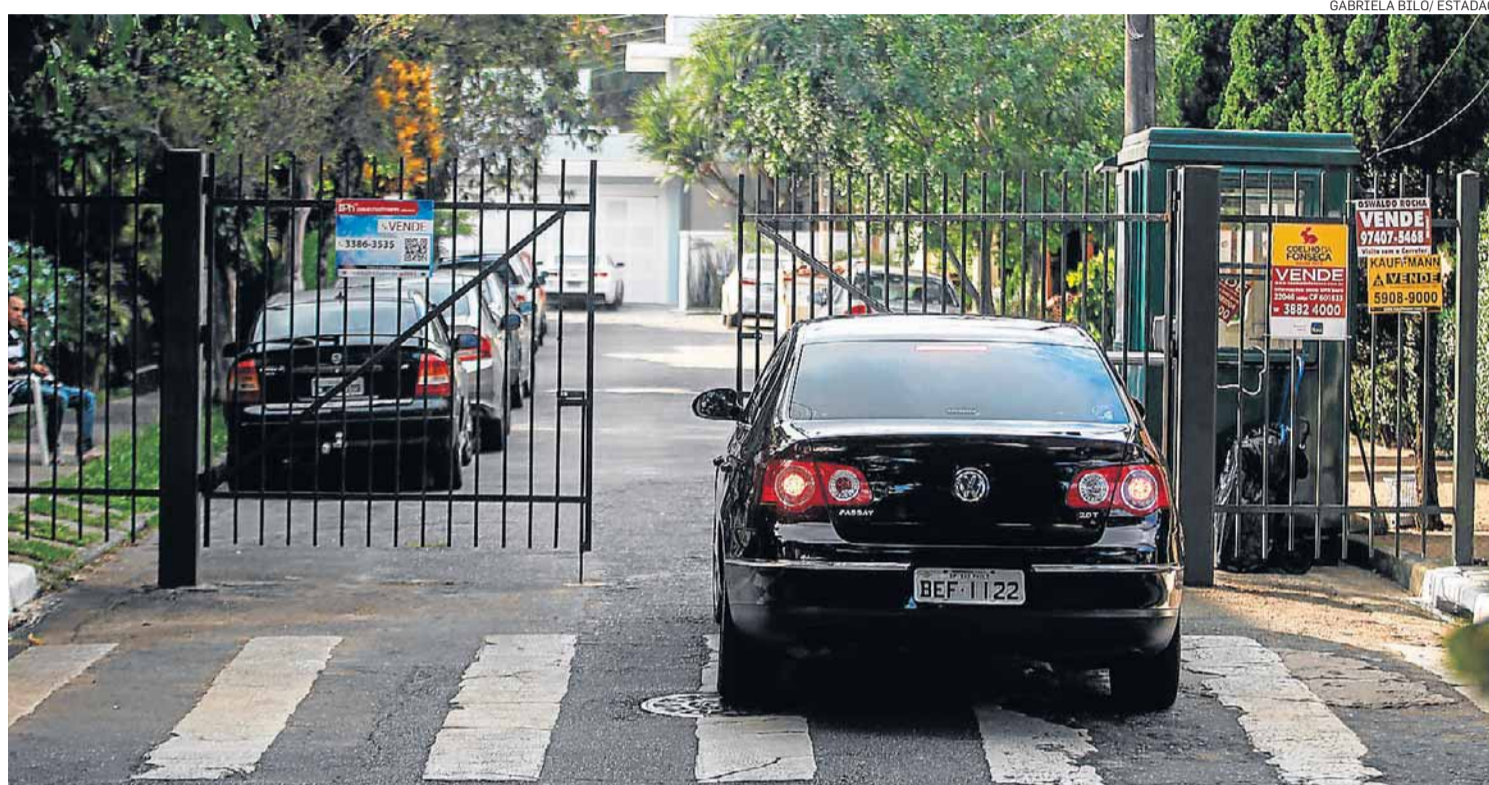
Polêmica deve ter solução legislativa. Haddad afirmou que nova lei de uso e ocupação do solo deverá tratar do assunto

Ao Estado , ele afirmou que essa solução faz parte dos planos da Prefeitura de aumentar suas vendas de ativos. Em plena crise financeira, a privatização das vilas teria função dupla: elevar a receita e resolver o imbró-